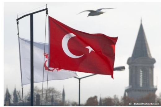
Nach dem Referendum in der Türkei über Beobachter weiter harsche Kritik

Verfassungsreferendum Kritik und Manipulationsvorwürfe nach Türkei-Referendum Robert Kiesel • 21. April 2017