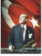
Atatürkçü Düşünce Derneği Berlin-Brandenburg